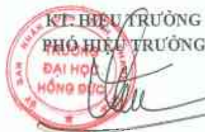
Đậu Bá Thìn